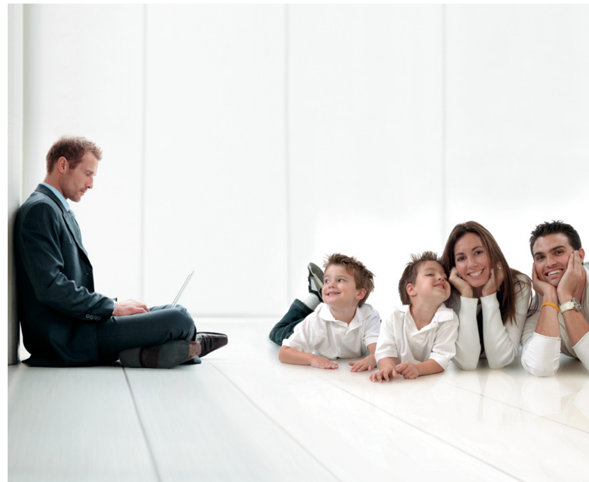
ОАО АКБ «РОСБАНК», Группа «Содет Жакераль», Реклама.

Вы хотите иметь стабильный доход в надежном банке? Тогда откройте в Росбанке сберегательный вклад «Эталон+» с неограниченными возможностями управления вашим вкладом. Вас заинтересуют привлекательные ставки, которые не меняются при снятии средств со счета по вкладу. Вы сможете пополнять или снимать часть средств со счета в любой момент, а также легко пользоваться интернет-банком для совершения операций по вкладу.