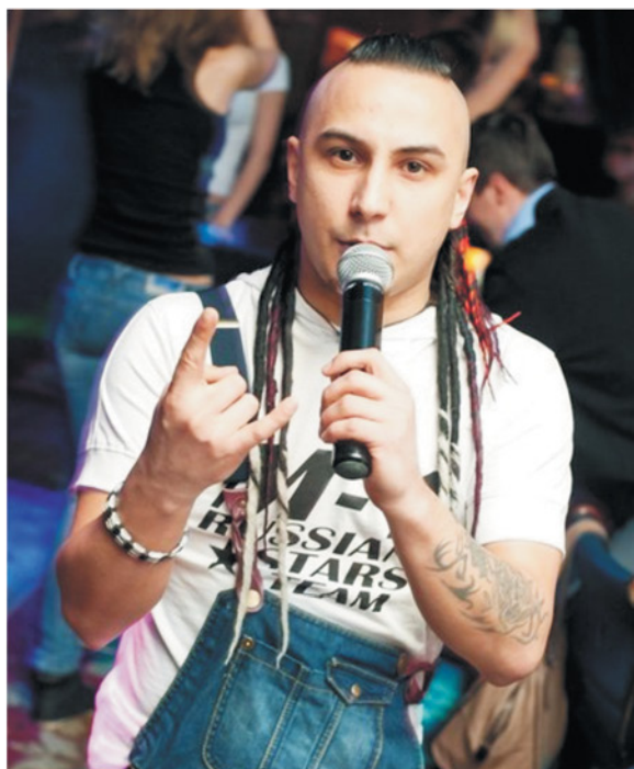
MC MAGNUM (SPB) ТАЛАНТЛИВЫЙ ПЕВЕЦ И MC